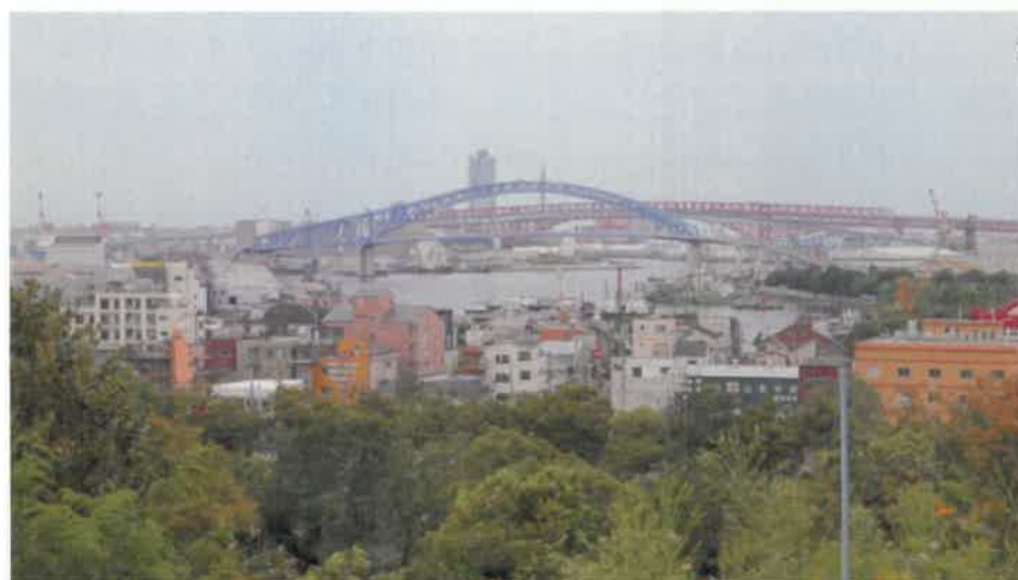
昭和三山頂から見た千歳橋と大正内港