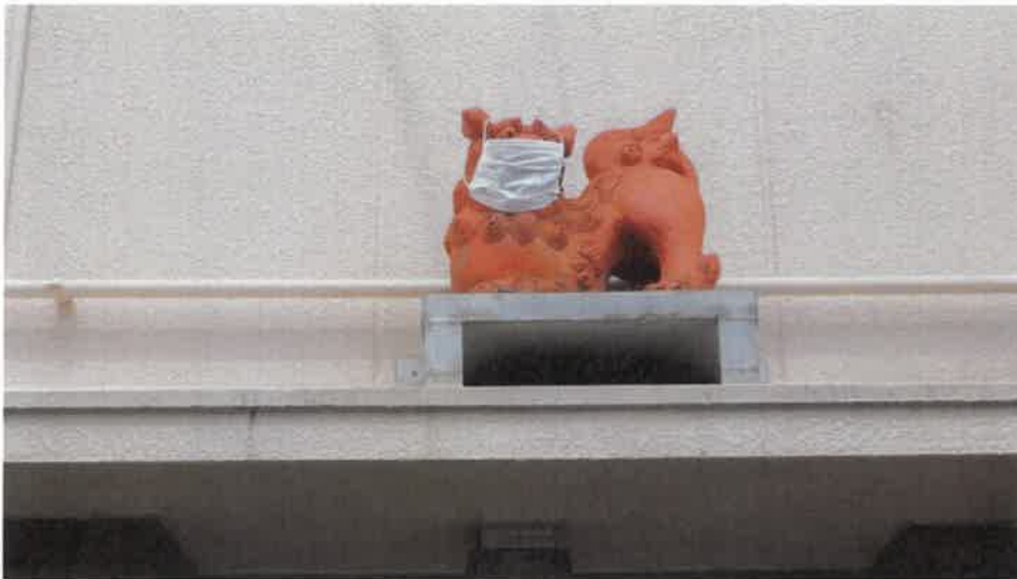
マスクをつけたシーサー

最後に余談ながら、取材に訪れた日は時季が早かったせいで見られなかったが、木津川では毎年10月下旬から翌年4月下旬にかけて、数百羽のユリカモメを見ることができるという。ユリカモメは冬の渡り鳥で、標識調査により、主にカムチャッカ半島から渡ってくるということが分かっている。