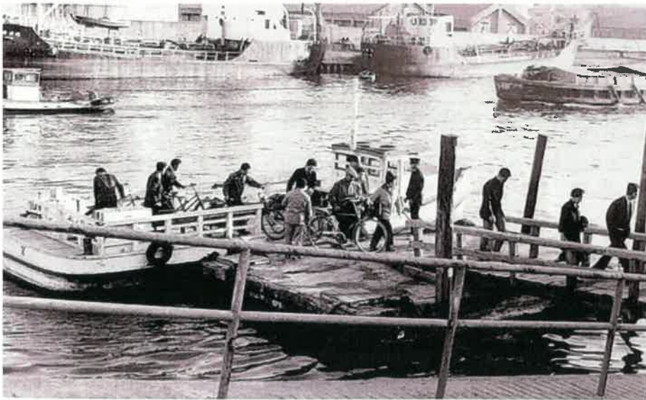
昭和40年頃（航路不詳）

渡船が運行されているのは、大阪市西部にある港区・大正区のエリア。最盛期には31カ所あったが、道路整備が進むにつれて減少し、今残るのは8航路。渡船は大阪市が管理・運営するれっきとした交通インフラで、人と自転車に限り誰でも無料で乗船できる。運行間隔は時間帯によって異なるが、10～30分ごとに1往復している。