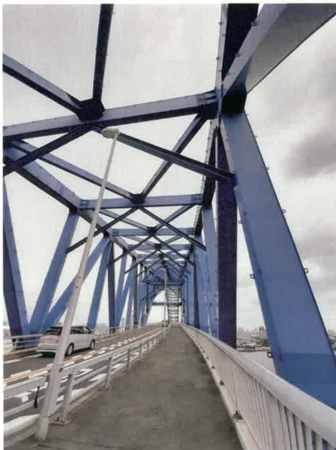
千歳橋・やっと上ってきたあと歩いて渡る

それでも取材中には、徒歩や自転車で渡る人をチラホラ見かけた。上ってみると見晴らしはよく、天気良ければ大正内港が一望でき、遠くはあべのハルカスまで見通せる。