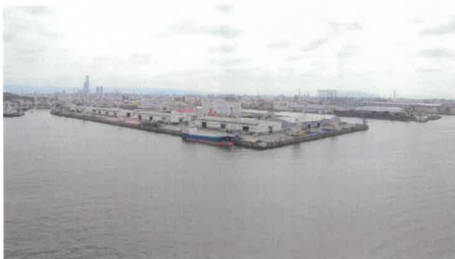
千歳橋の上から見た大正内港・あべのハルカスも見える

それでも取材中には、徒歩や自転車で渡る人をチラホラ見かけた。上ってみると見晴らしはよく、天気良ければ大正内港が一望でき、遠くはあべのハルカスまで見通せる。