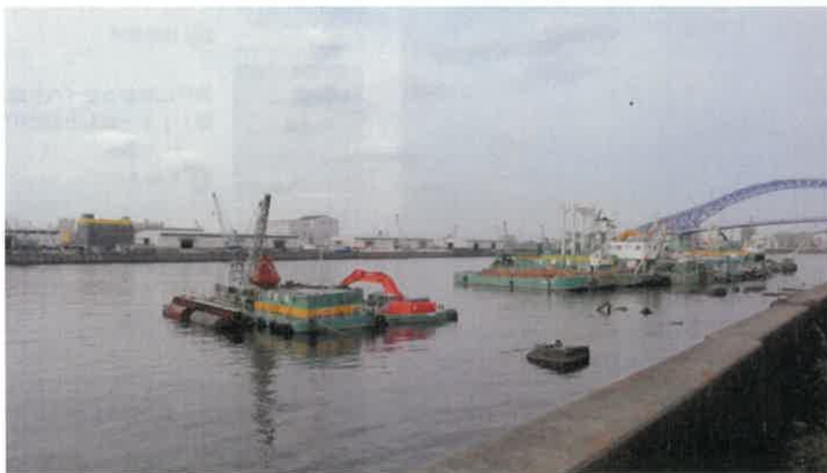
地上から見た大正内港

8航路のうち最も長い航路は港区と此花区を結ぶ天保山渡船場の400mだが、大正区内に限れば、千歳渡船場が最も長い371mとなっている。