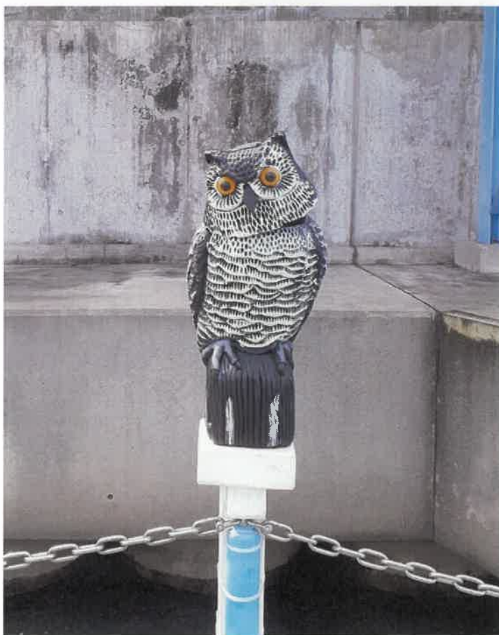
このフクロウの置物があるだけで野鳥が寄り付かないという

乗り場の一角にあるポールに、よくできたフクロウの置物がある。同じものが落合上渡船場にもあったので、ちょっと気になっていた。船頭さんに尋ねたら、野鳥よけとのこと。サギをはじめ野鳥がやってくると、場所を選ばず糞を落としていく。それを防止するためだそう。