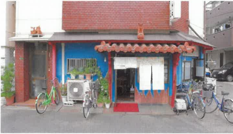
軒先のシーサーにマスクが……