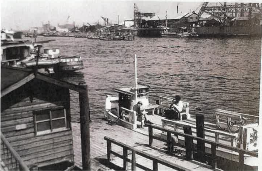
昭和40年頃の落台上渡船場

乗り場から上流のほうへ目をやると、木津川水門がそびえている。防潮のために設けられたもので、近畿地方が甚大な被害を受けた2018年の台風21号が上陸した折には閉鎖されて、大阪の街を高潮から守った。