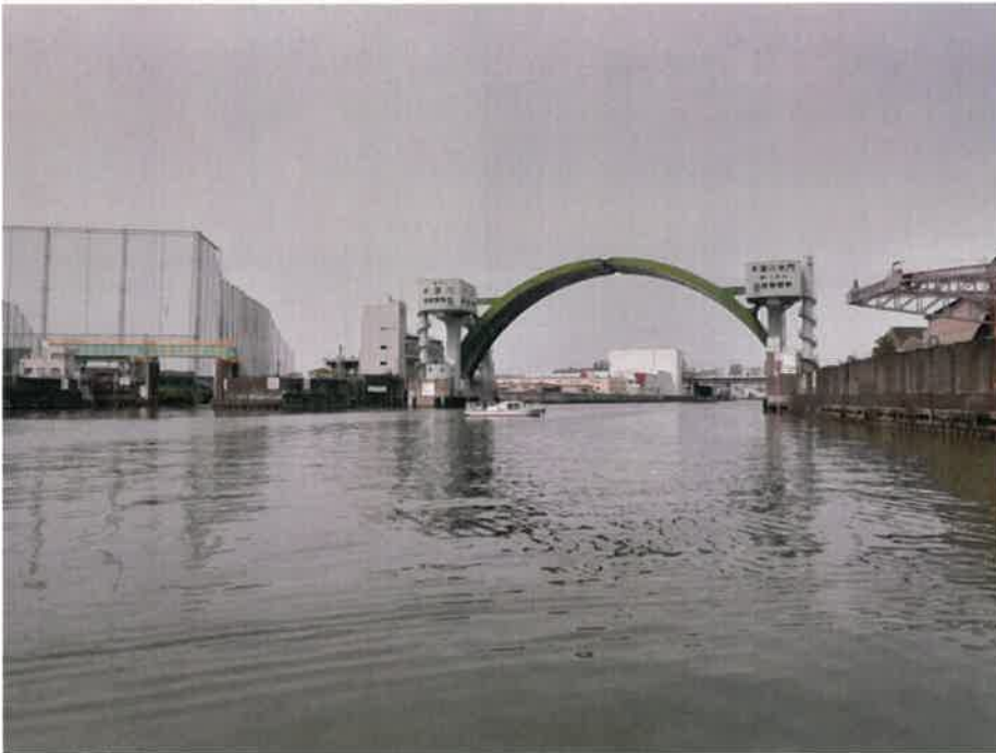
大阪を高潮から守った木津川水門

千島側で船を降り、道なりに10分ほど歩くと、広いオープンスペースに店舗が立ち並ぶ千島ガーデンモールというショッピングモールがある。ここを訪れたら、片隅の通路に展示されている2枚のパネルを見てほしい。いずれも大正区の航空写真で、1枚は終戦から2年後の1947年、もう1枚は2003年と表示されている。大正内港が建設される前と現代の対比が興味深い。