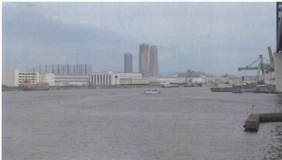
渡船は大きく弧を描いて進む・千歳渡船場

かつては「水の都」とも呼ばれ、市街地を多くの川が流れる大阪。大阪湾にほど近いベイエリアでは、古くから川の各所に無料の「渡船」が設けられ、日常的な市民の足として親しまれている。渡船をめぐり歩くと、ローカル色あふれる大阪の景色が見えてくる。「リトル沖繩」と呼ばれる情緒のある街並みに、大阪で2番目に高い人工の山ができた理由…。ちょっとした船旅気分を味わいながら、水都・大阪ならではの暮らしを訪ねてみよう。