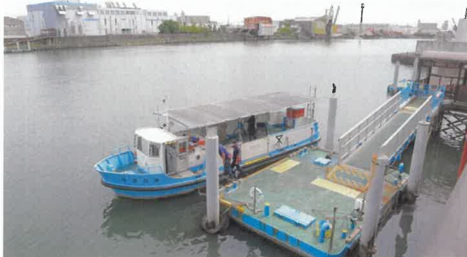
落合下渡船場…近くには「リトル沖縄」の中心地として知られる平尾本通商店街（サンクス平尾）がある

乗り場の一角にあるポールに、よくできたフクロウの置物がある。同じものが落合上渡船場にもあったので、ちょっと気になっていた。船頭さんに尋ねたら、野鳥よけとのこと。サギをはじめ野鳥がやってくると、場所を選ばず糞を落としていく。それを防止するためだそう。