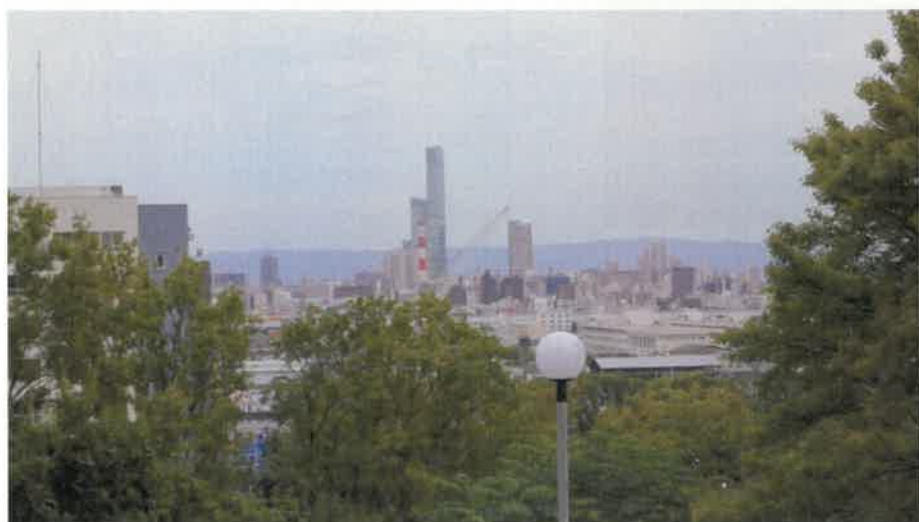
昭和三山からあべのハルカスが見える