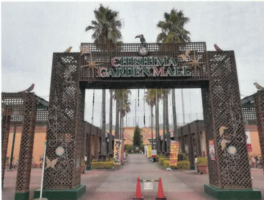
千島ガーデンモール

千島側で船を降り、道なりに10分ほど歩くと、広いオープンスペースに店舗が立ち並ぶ千島ガーデンモールというショッピングモールがある。ここを訪れたら、片隅の通路に展示されている2枚のパネルを見てほしい。いずれも大正区の航空写真で、1枚は終戦から2年後の1947年、もう1枚は2003年と表示されている。大正内港が建設される前と現代の対比が興味深い。