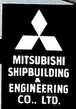
三菱水中翼船 MH-3型(10人乗)