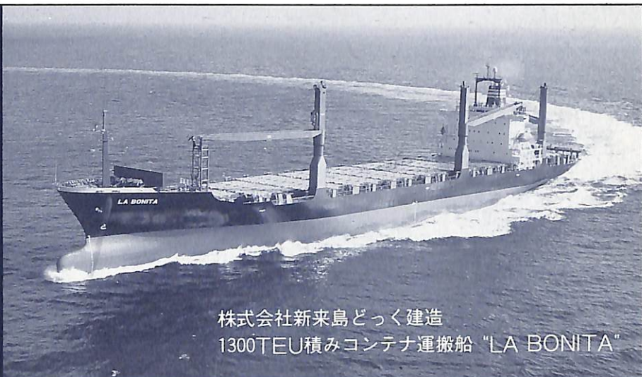
株式会社新来島どっく建造 1300TEU積みコンテナ運搬船 "LA BONITA"