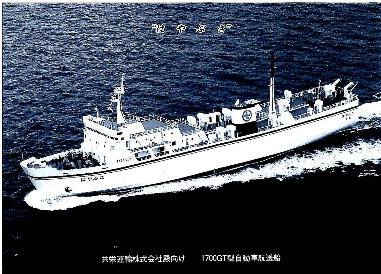
共栄運輸株式会社殿向け 1700GT型自動車航送船