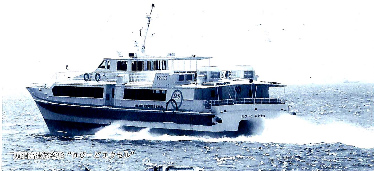
双胴高速旅客船“れびどエクスセル”