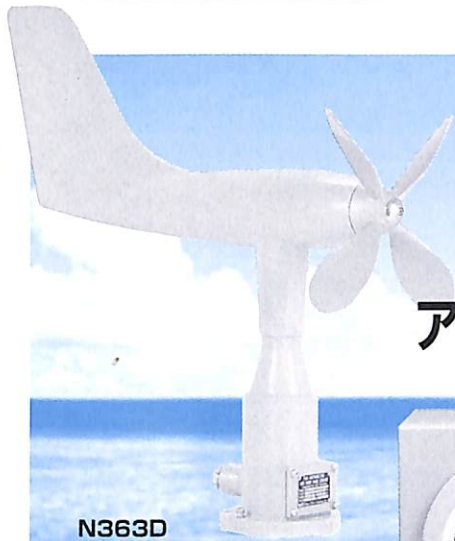
N363D 真風向風速発信器