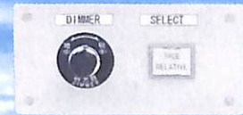
DM4 外部ディマー・真/相対切替スイッチ