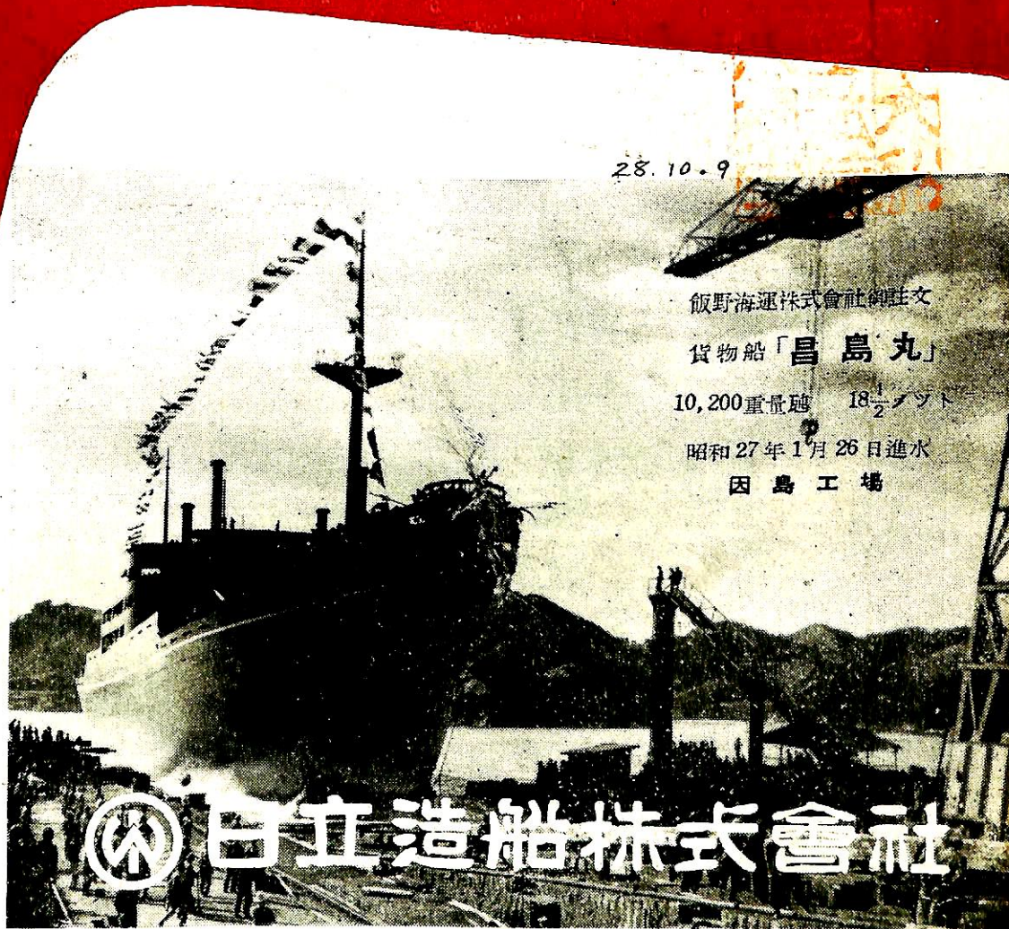
飯野海運株式会社の注文 貨物船「昌島丸」 10,200重量噸 18 \frac{1}{2} ノット 昭和27年1月26日進水 因島工場

昭和五年三月二十日 第三種郵便物認可 昭和二十四年三月二十八日 郵政省特許認可 昭和二十七年二月七日 印刷 昭和二十七年三月十二日 發行