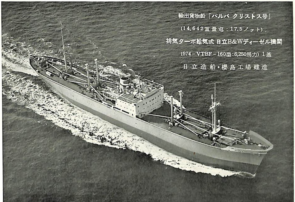
輸出貨物船「バルバ クリストス号」

昭和五年三月二十日 第三種郵便物認可 昭和三十一年一月十七日 発行 昭和二十四年三月二十八日 運輸省特別承認第百四〇六号