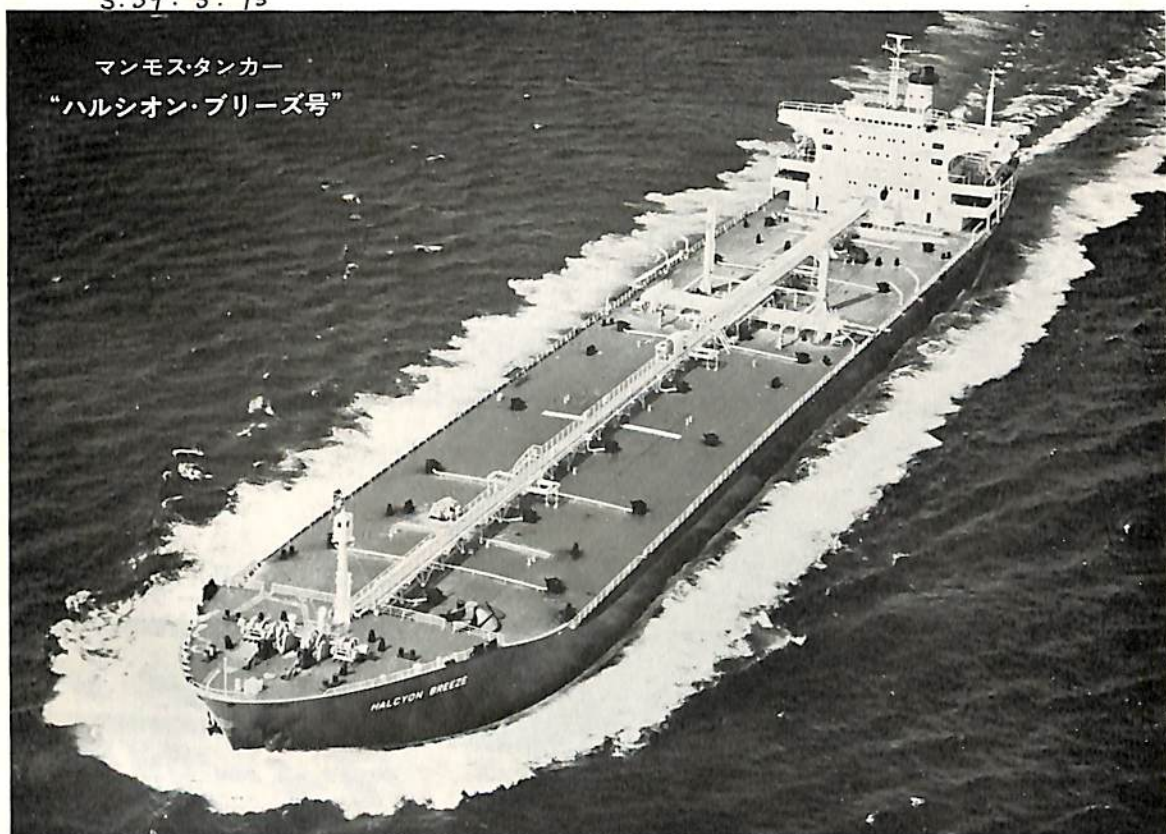
マンモスタンカー “ハルシオン・ブリーズ号”