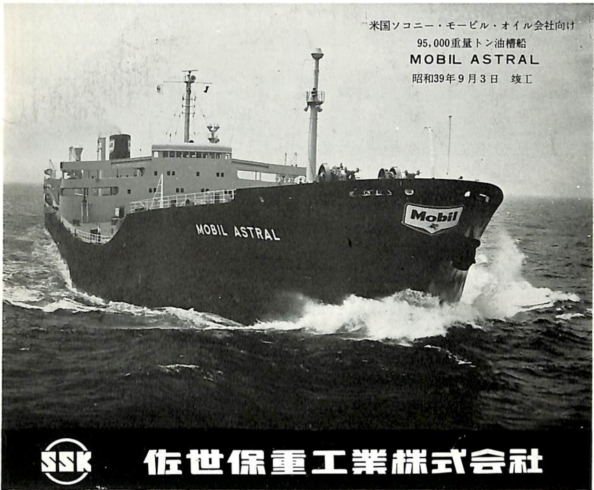
米国ソコニー・モービル・オイル会社向け 95,000重量トン油槽船 MOBIL ASTRAL 昭和39年9月3日 竣工