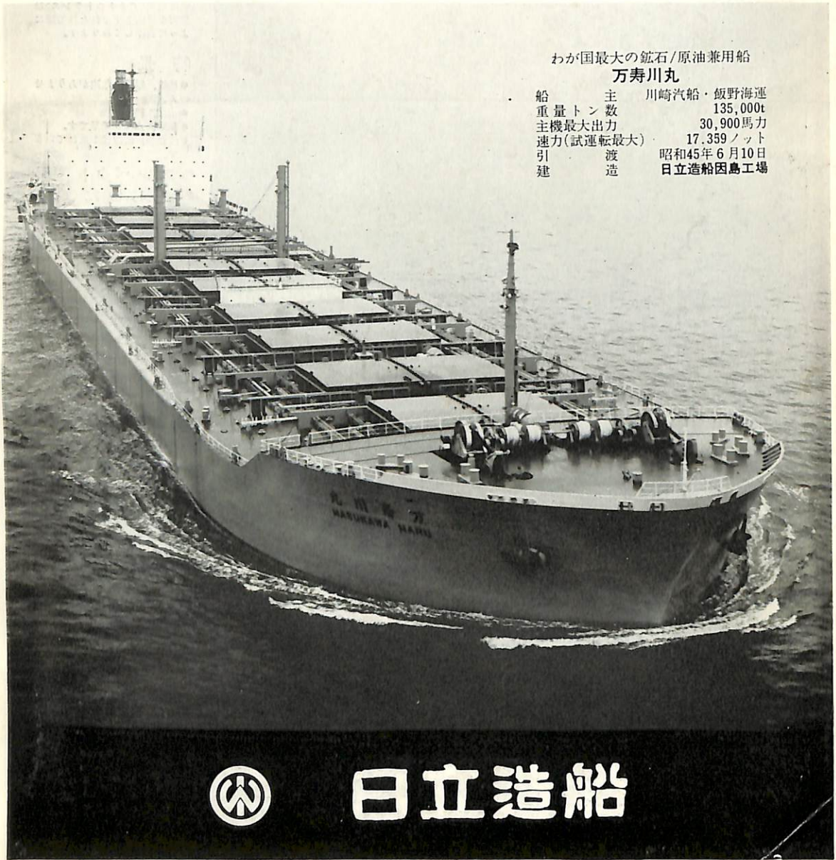
わが国最大の鉱石/原油兼用船 万寿川丸

昭和五十五年三月二十日 第三種郵便物認可 昭和四十五年七月七日 発行 昭和二十四年三月二十八日 国鉄特別承認雑誌第四〇六号