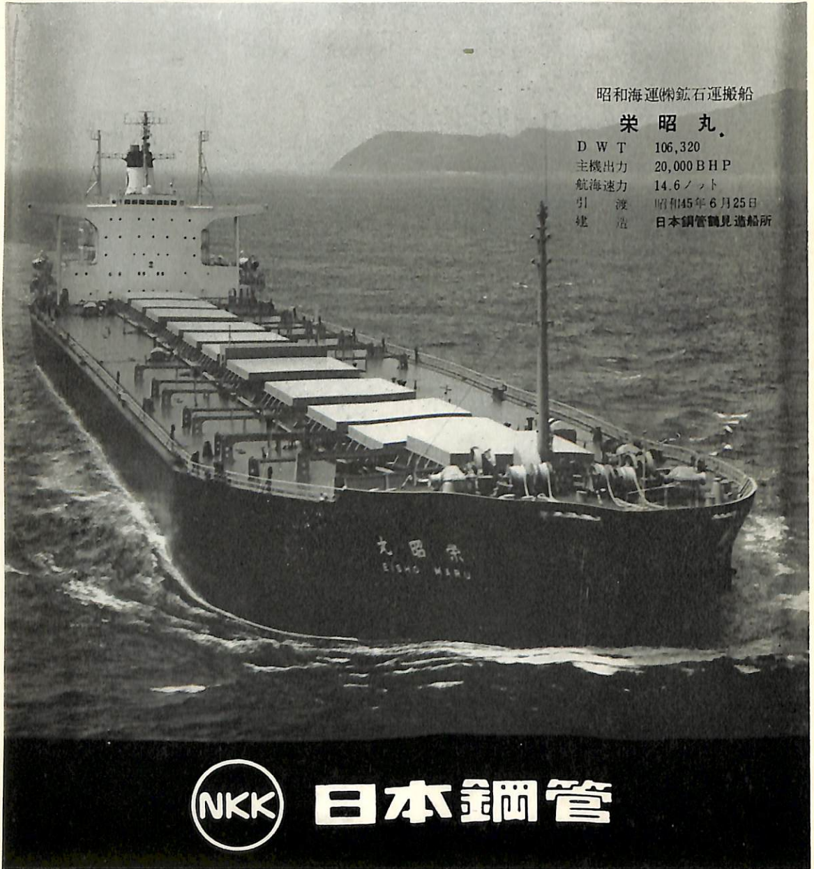
昭和海運(株)鉱石運搬船

昭和五十二年三月二十日 第三種郵便物認可 毎月一回 十二日 発行 昭和四十五年十月七日 印刷 昭和二十四年三月二十八日 郵政特別承認 第四〇六号 発行