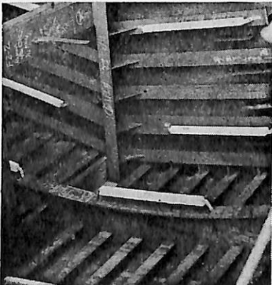
アルミ陽極取付 バラストタンク

本 社 ・ 東 京 都 千 代 田 区 鍛 冶 町 2 - 2 - 2 ☎ ( 252 ) 3171 支 店 ・ 大 阪 市 東 淀 川 区 西 中 島 5 - 1 0 1 ☎ ( 303 ) 2831 営 業 所 ・ 名 古 屋 ☎ ( 962 ) 7866 ・ 広 島 ☎ ( 48 ) 0524 ・ 福 岡 ☎ ( 77 ) 4664 出 張 所 ・ 札 幌 ・ 仙 台 ・ 新 潟 ・ 千 葉 ・ 水 島 ・ 高 松 ・ 大 分 ・ 沖 縄