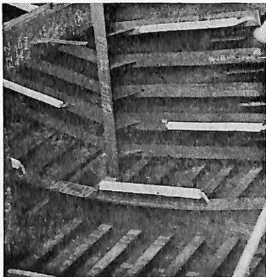
アルミ陽極取付 バラストタンク

本 社・東京都千代田区鍛冶町2-2-2 ☎(252)3171 支 店・大阪市東淀川区西中島5-1-01 ☎(303)2831 営業所・名古屋☎(962)7866・広島☎(48)0524・福岡☎(77)4664 出張所・札幌・仙台・新潟・千葉・水島・高松・大分・沖縄