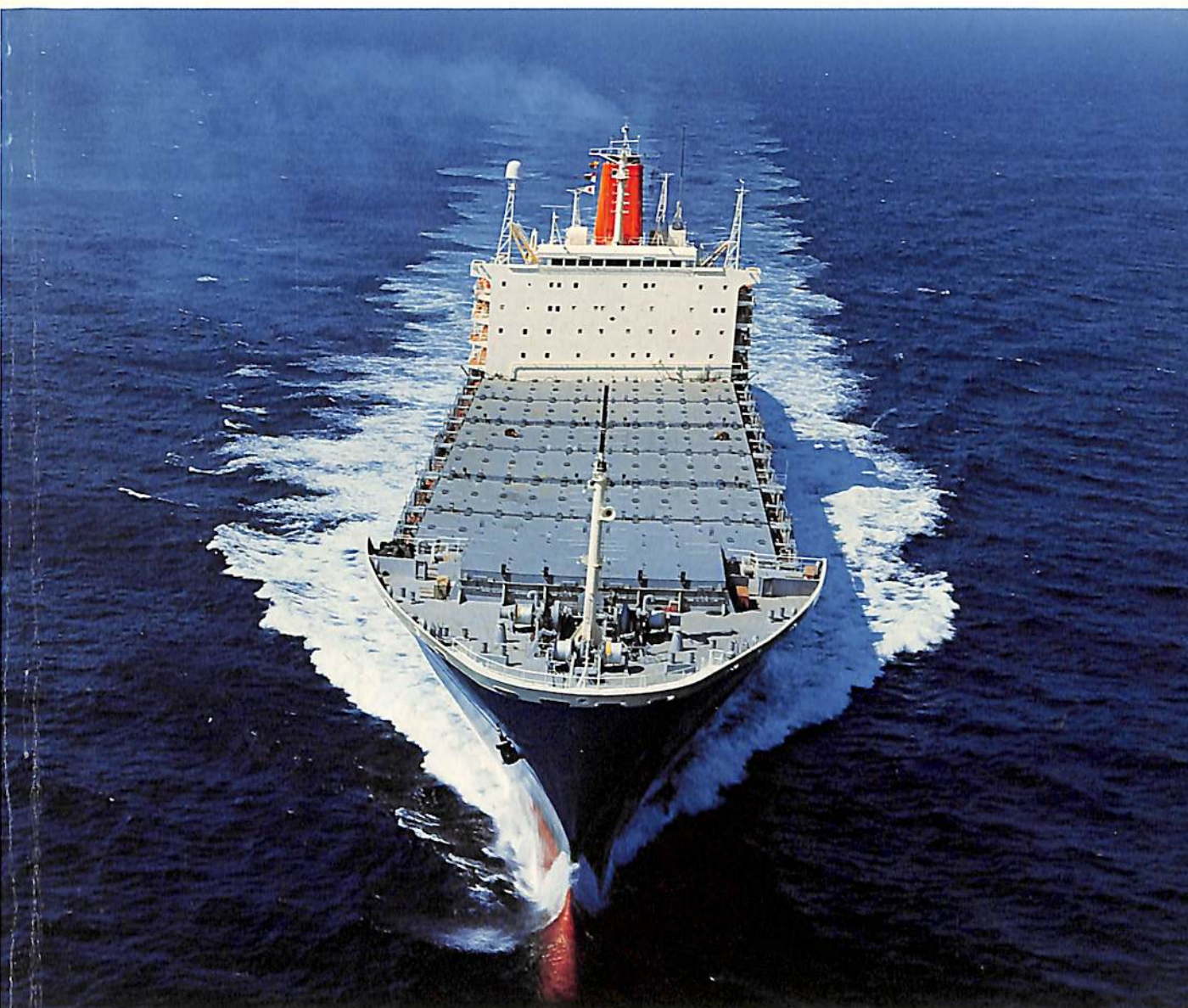
玉野事業所で竣工した商船三井向けコンテナ船“きゃんべら丸”

NYKの中型浅吃水タンカー“丹波丸”／RORO 船“神明丸”／連載・FRP船講座